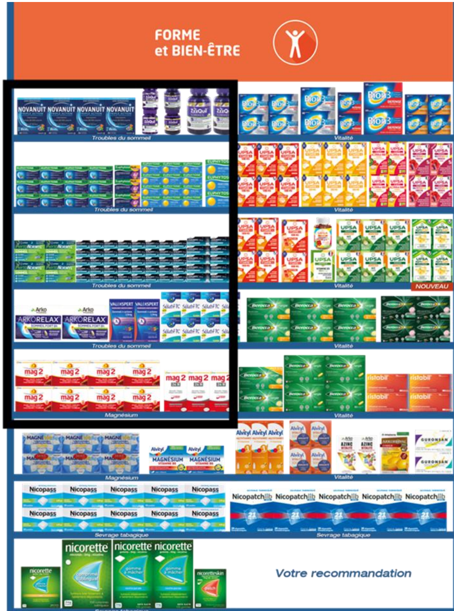
Visuels à titre de recommandation